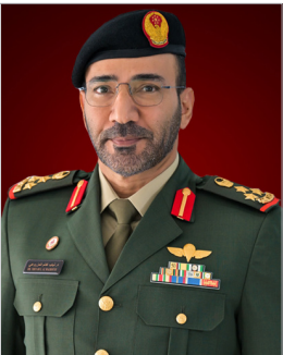
العميد الركن / ذياب غانم المزروعي هيئة التوجيه - كلية الدفاع الوطني